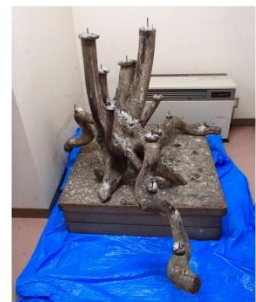
体育館(最大22本) ※ミーティングルームにあります。