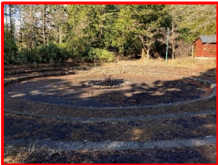
【第一営火場】 最大定員：約 300 名 電源、照明、水道有、円形3段づく