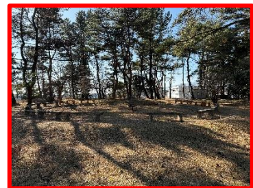
【第三営火場】 最大定員：約 100 名 電源、照明、水道有、木製ベンチ有、円形フラット