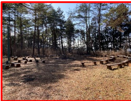
【第二営火場】 最大定員：約 200 名 電源、照明、水道有、木製ベンチ有、円形フラット