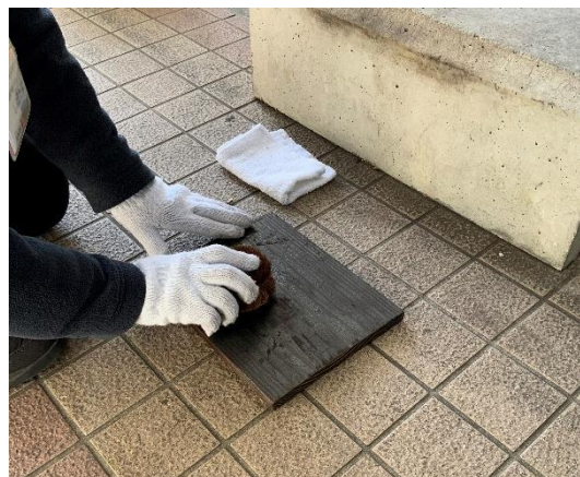
たわしと雑巾ですすを落とす。