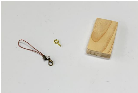
材料一式（小板は6cm程度）