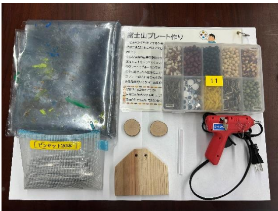
材料一式 ※装飾物は10人に1セット程度