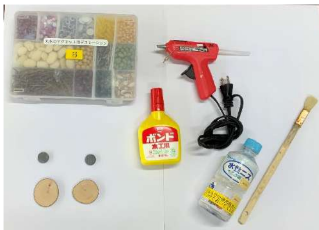
材料一式 ※デコレーションセットは10人に1セット程度