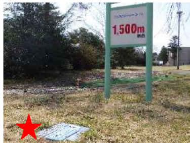
ピザ生地には欠かせない