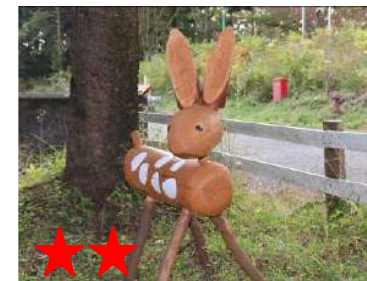
★★ 菌を植えると木から生えてくる