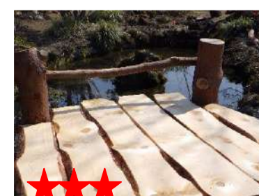
オリーブ・サラダなど多くの種類がある