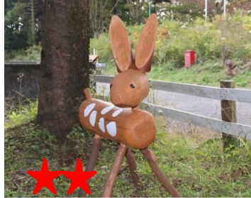
★★★ 切ると涙がでてくる