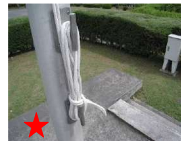
野外炊事には欠かせない