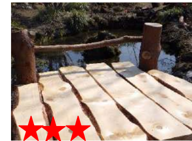
これで味が決まる！