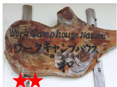
★★ ビールのお供に・・・