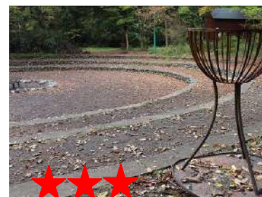
★★★★ やすくておいしい野菜