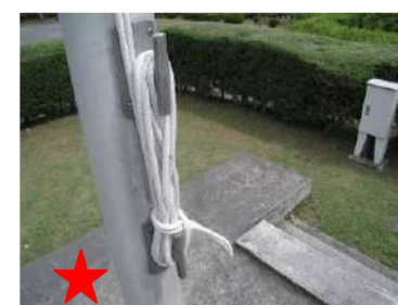
★ 風邪の予防にも効く長〇〇