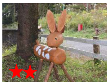
切ると涙が・・・