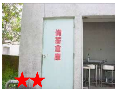
★★ 苦手な人が多い野菜だよ