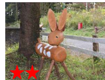
★★ 切ると涙がでてくる