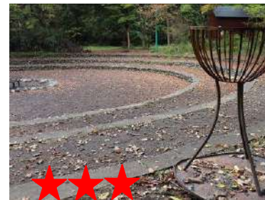
★★★★ 演技の下手な〇〇役者