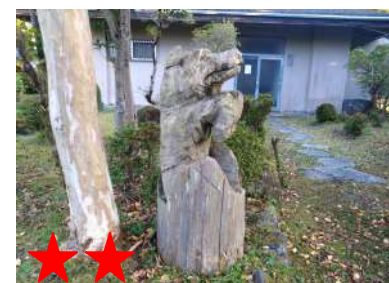
赤・黄・緑色がある野菜