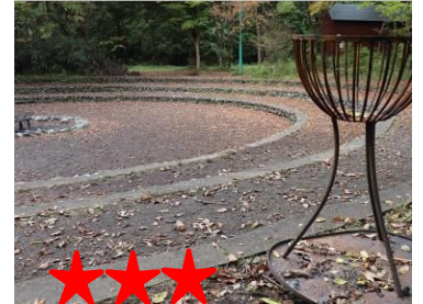
★★★★★ やすくておいしい野菜