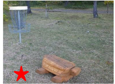
★ うさぎの好きな食べ物