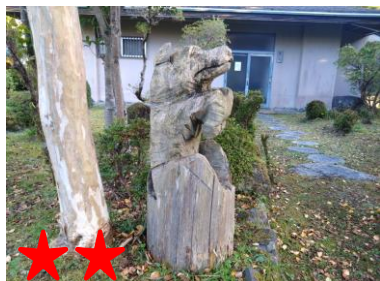
★★★ 焼きそばの味の決め手