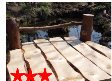
★★★★★ いため物には必じゅ品