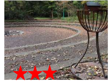
ジャムおじさんの愛犬