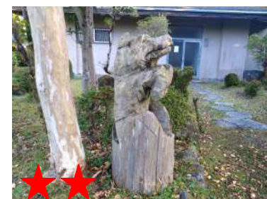
★★ 焼肉には必じゅ品