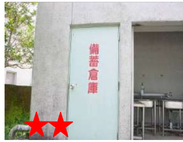
カツオではなくマグロだよ