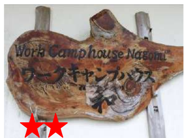
ポテトチップスの原料