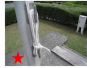
野外炊事には欠かせない