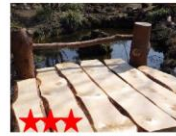
オリーブ・サラダなど多くの種類がある