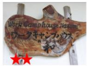
ポテトチップスの原料