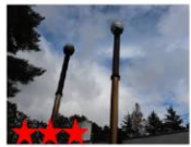
これで味が決まる！！