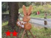
切ると涙が・・・