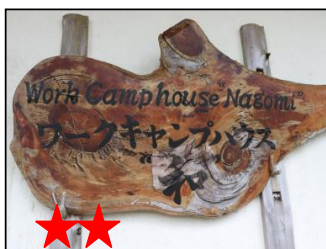
ポテトチップスの原料