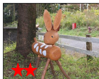
切ると涙が・・・