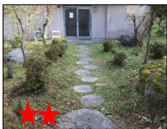
★★★ 焼肉には絶対必要