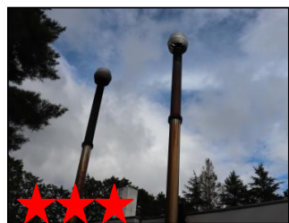
★★★★★ 青虫が大好きな・・・