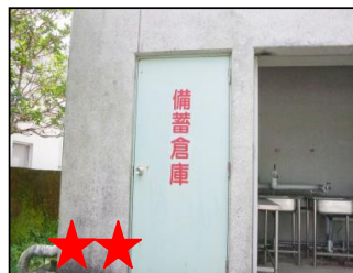
カツオではなくマグロだよ