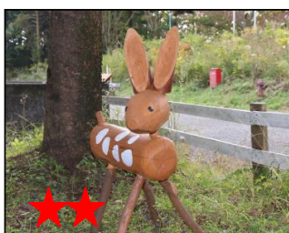
★★★ 切ると涙が・・・