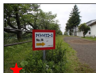
オリーブ・サラダなど多くの種類がある