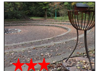
★★★ 演技の下手な〇〇役者