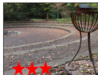
★★★★★ 安くておいしい・・・