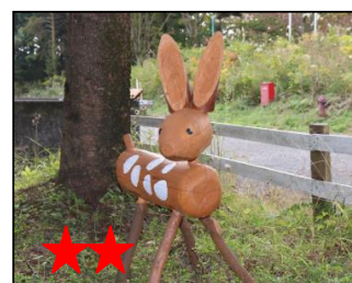
★★★ 菌を植えると木から生えてくる