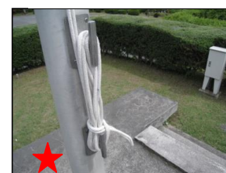
★ 風邪の予防にも効く長〇〇