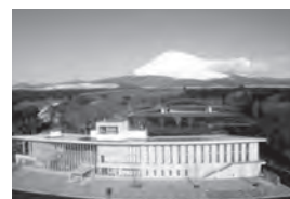
〈ビジターセンター〉

富士山を世界に発信する、「遊んで、学んで、癒されて」をテーマとする自然に囲まれた公園施設。富士山立体模型と大型スクリーンで、富士山の成り立ちや富士山世界遺産解説映像を上映する「天空シアター」。屋外には子供たちがおもいっきり遊べる「冒険の丘」。友人や家族でプレーを楽しめる「パークゴルフ場」。富士山関係のお土産やめずらしい自衛隊グッズが人気の「売店」。園内散策で四季折々の花を楽しめます。