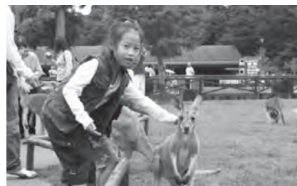
〈カンガルーとのふれあい〉

「どうぶつ村」には、アルパカやカバなどがいて、ウサギをだっこしたり、エサをあげたりできます。