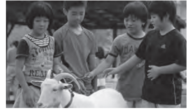
〈ヤギとのふれあい〉