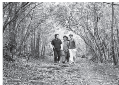
〈青木ヶ原樹海内に整備された東海自然歩道〉

青木ヶ原樹海は、富士山が噴火した際に流れ出した溶岩流が固まり、その上に形成された樹林として日本で唯一にして最大級の原生林です。土が少なく、溶岩の上に生育した木々独特の自然の中には多くの動植物が生息しています。青木ヶ原樹海は約3,000haの広さがあり、東京ドーム約640個分という広大な樹林帯となっています。豊かな自然に親しむだけでなく、富士山の噴火の歴史を学習する場としても、大変貴重な自然環境となっています。