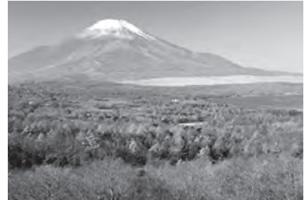
〈パノラマ台から見た富士山〉

山中湖を含む富士五湖は、富士山の北側を流れる地下水流を、富士山の噴火によって出た溶岩流がせき止めたことでできたと言われていています。周辺にはハイキングコースが整備されており、富士山と山中湖の雄大な景色をはじめ、多くの自然に触れることができます。