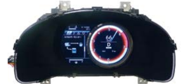
走る楽しさを演出する フルグラフィックメーター