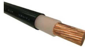
工事の安全性と作業性の 向上に貢献する『やわらか電線』