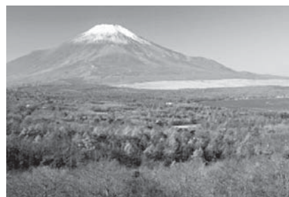
〈パノラマ台から見た富士山〉

山中湖を含む富士五湖は、富士山の北側を流れる地下水流を、富士山の噴火によって出た溶岩流がせき止めたことでできたと言われていています。周辺にはハイキングコースが整備されており、富士山と山中湖の雄大な景色をはじめ、多くの自然に触れることができます。