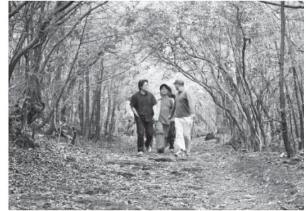
〈青木ヶ原樹海内に整備された東海自然歩道〉

青木ヶ原樹海は、富士山が噴火した際に流れ出た溶岩流が固まり、その上に形成された樹林として日本で唯一にして最大級の原生林です。土が少なく、溶岩の上に生育した木々独特の自然の中には多くの動植物が生息しています。青木ヶ原樹海は約3,000haの広さがあり、東京ドーム約640個分という広大な樹林帯となっています。豊かな自然に親しむだけでなく、富士山の噴火の歴史を学習する場としても、大変貴重な自然環境となっています。