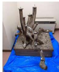
体育館(最大22本) ※ミーティングルームにあります。