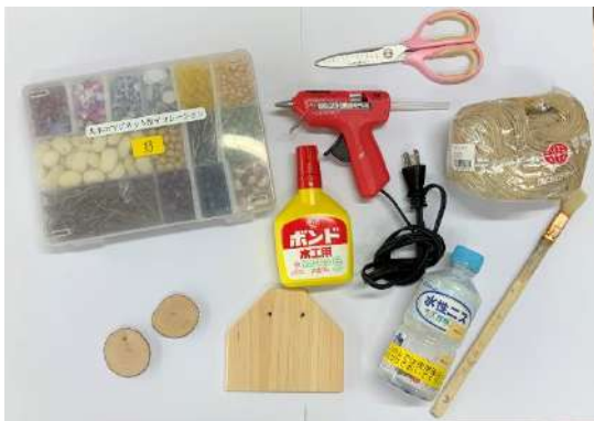
材料一式 ※デコレーションセットは10人に1セット程度